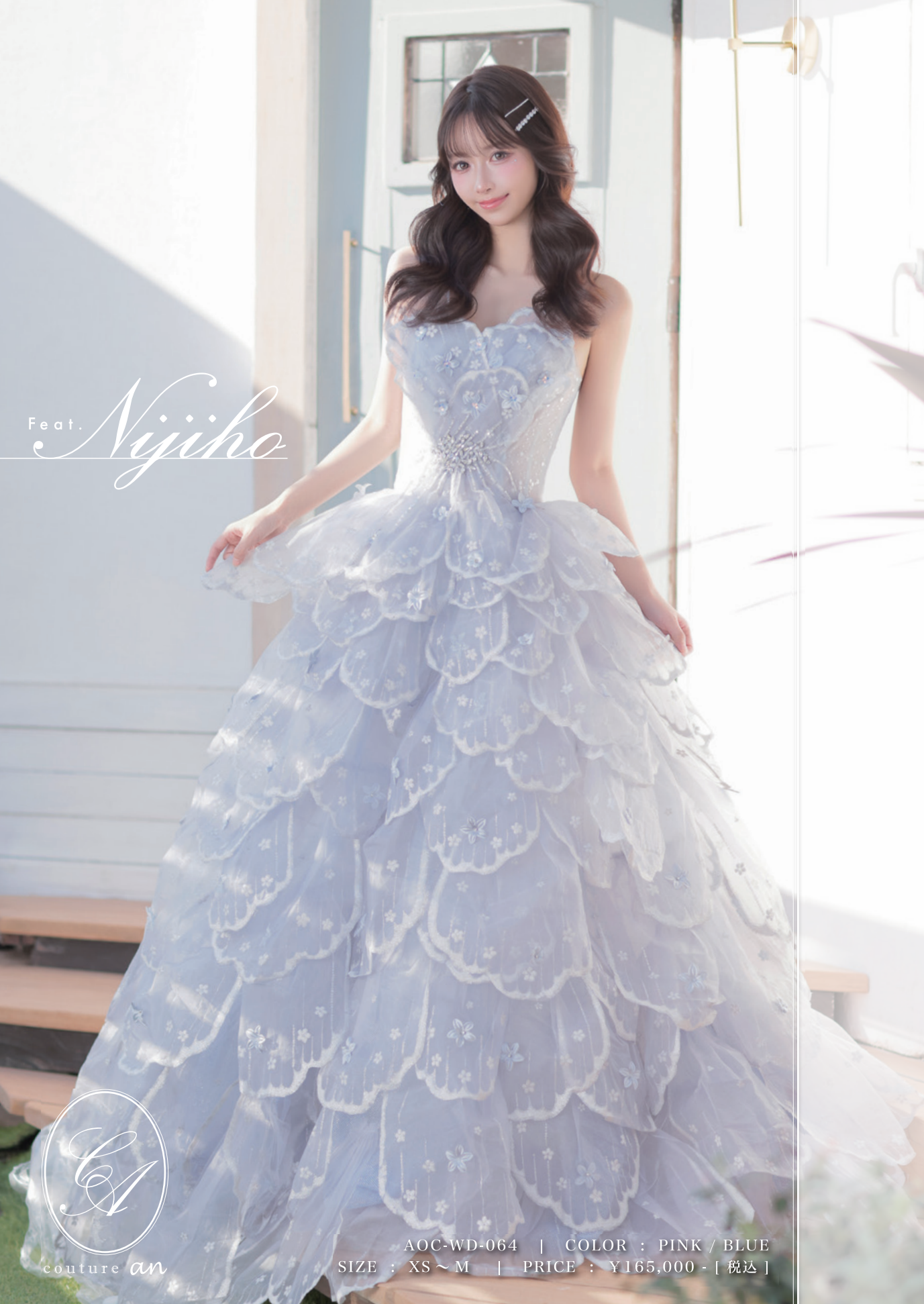
AOC-WD-064 | COLOR : PINK / BLUE SIZE : XS ~ M | PRICE : ¥165,000 - [税込]