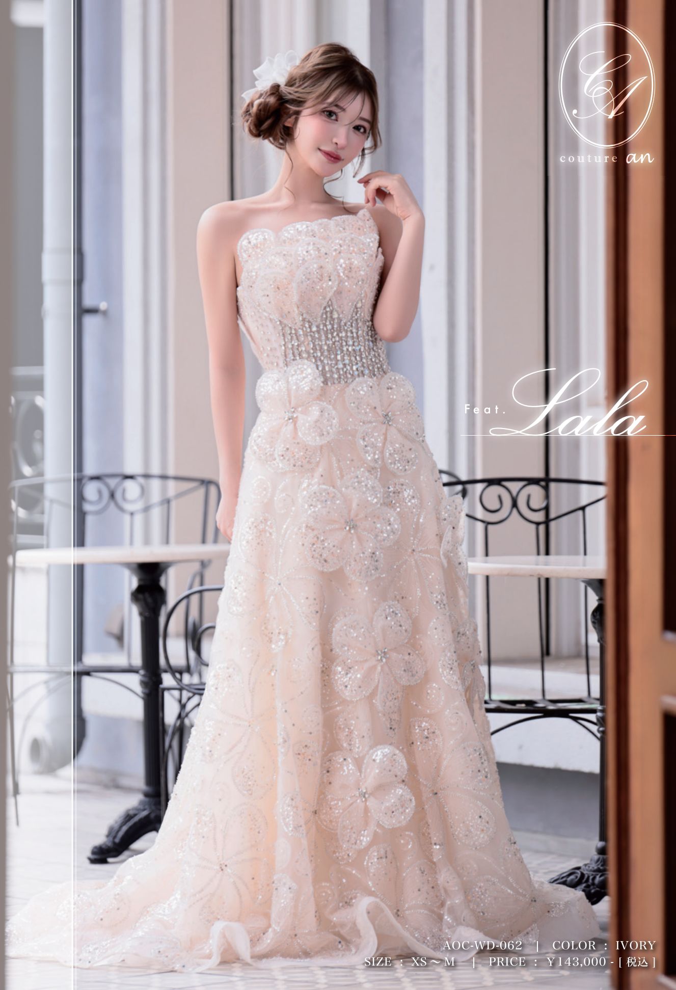
AOC-WD-062 | COLOR : IVORY SIZE : XS ~ M | PRICE : ¥143,000 - [税込]